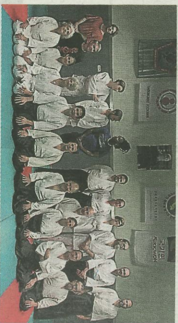
Les pratiquants font découvrir leur sport tous les lundis et jeudis.

► Correspondante Midi Libre : 06 02 08 83