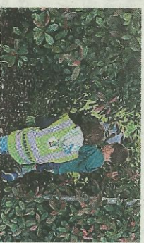
Les enfants participent avec enthousiasme chaque année.

> L'adhésion familiale annuelle à l'ARBRE peut se faire sur place, ou en ligne : https://arbr34160.org