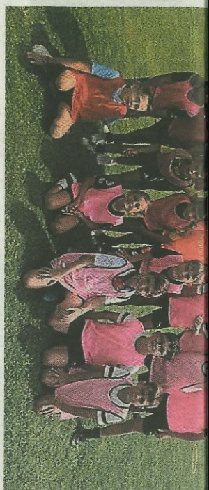
Lors du dernier stage, les footballeurs avec les chausubles roses.

► Correspondant Midi Libre : 06 10 97 14 44